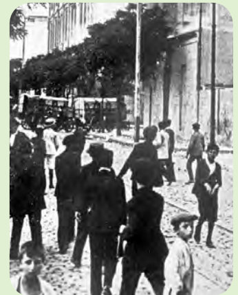
Disturbios callejeros de la Semana Trágica, en 1919. Los huelguistas fueron reprimidos brutalmente por el Ejército y por grupos de civiles armados.