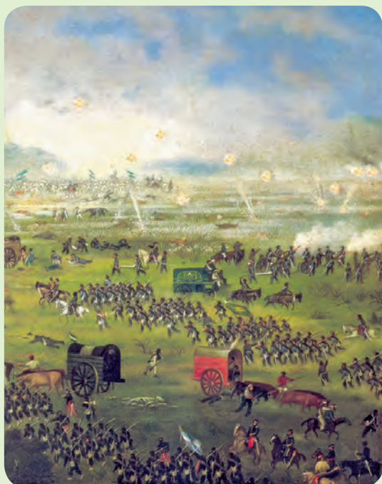
Cándido López, Ataque del Boquerón visto desde el Potrero Piris (1897), óleo sobre tela. Es uno de los episodios de la guerra de la Triple Alianza.

En una línea de tiempo, podemos señalar tanto hechos como procesos históricos. Los hechos históricos son acontecimientos de corta duración (por ejemplo, la batalla de Pavón) y se señalan con una marca perpendicular a la línea de tiempo. En cambio, los procesos históricos son de mayor duración (por ejemplo, la guerra de la Triple Alianza, o las presidencias) y se señalan con una banda paralela a la línea que abarca la duración del proceso que se quiere representar. Por ejemplo: